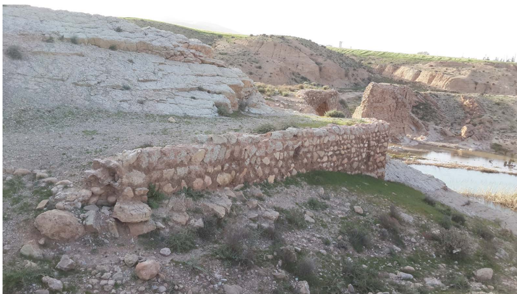
تصویر ۱۶. صفه در سمت جنوب پل که بالاجبار به جهت دور زدن صخره ساخته شده است (نگارندگان، ۱۳۹۶).