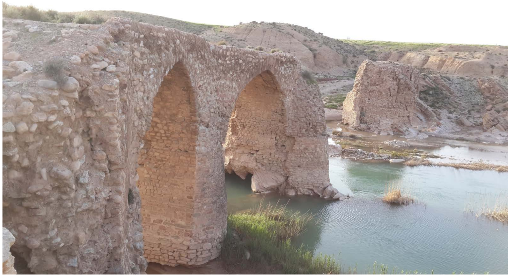
تصویر ۱۳. نمای پل از سمت جنوب شرقی (نگارندگان، ۱۳۹۶).