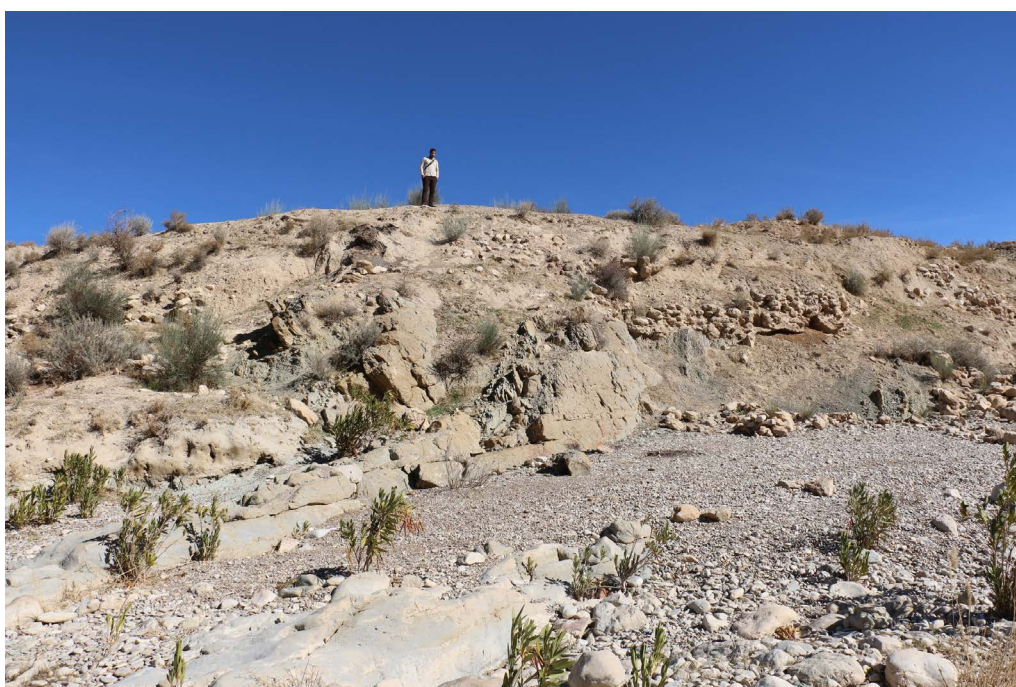
تصویر ۳. بخش دیگری از سنگ چین دیواره (نگارندگان، ۱۳۹۶).