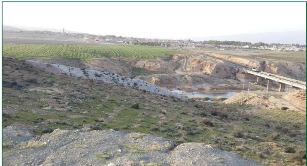
تصویر ۸. قسمتی از پل کوار به همراه شهر کوار در انتهای تصویر. تصویر از سمت جنوب (نگارندگان، ۱۳۹۶).

۹/۴۰ متر از کف بستر رودخانه تا زیر طاق است که با احتساب ۱/۱۰ ضخامت گذرگاه پل می‌توان ارتفاع کل سازه را ۱۰/۵۰ دانست (تصاویر ۸ تا ۱۶). در ساخت پل به جهت مقابله با جریان آب و جلوگیری از آسیب به پایه میانی از حوضچه آرامش طبیعی که در بستر رودخانه قرار داشته، استفاده کرده‌اند و پایه میانی پل را بعد از این حوضچه ساخته‌اند و بدون شک در طول تاریخ چندین نوبت پل مورد مرمت قرار گرفته است که تماماً بر پیکره پل قابل مشاهده است، ولی تخته‌سنگ‌های پایه پل گویای معماری ساسانی است.