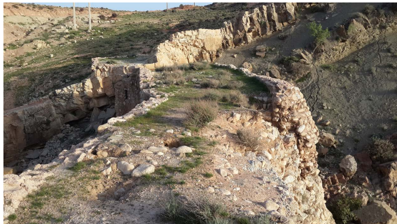
تصویر ۱۵. به علت قرارگیری صخره در سمت جنوب بالاجبار مسیر پل منحرف شده است (نگارندگان، ۱۳۹۶).