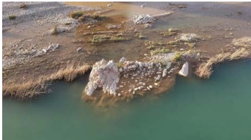
تصویر ۱۴. اثر فعلی باقی مانده از پایه میانی پل (نگارندگان، ۱۳۹۶).