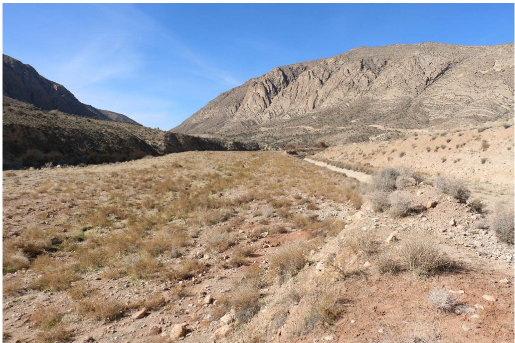
تصویر ۵. مکان حفر قنات که به علت ساخت کانال جدید و تسطیح، آثار قنات کاملاً از بین رفته است (نگارندگان، ۱۳۹۶).