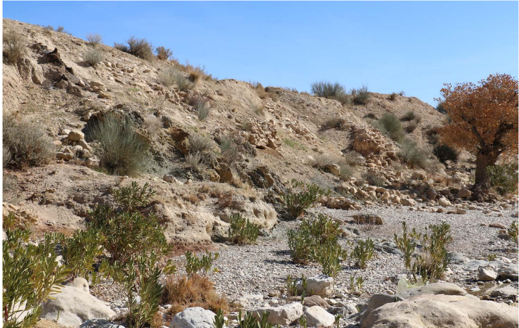
تصویر ۴. نمایی دیگر از سنگ‌چین سازه که به جهت جلوگیری از فرسایش دیواره ساخته شده است (نگارندگان، ۱۳۹۶).

متوصل می‌شده‌اند و آب را در بخشی از مسیر به وسیله قنات منتقل می‌کرده‌اند تا در نهایت به زمین‌های زراعی و محدوده مصرفی برسانند. ابراهیم رایگانی در رساله دکتری خود تعدادی از این سازه‌های جانبی و تأسیساتی بندها را در منطقه ارجان شناسایی کرده است که در زیر به آن‌ها پرداخته شده است.