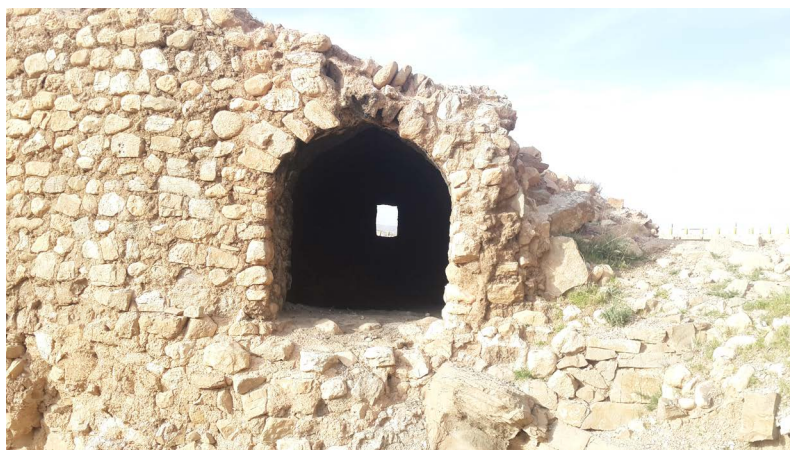
تصویر ۱۱. اتاقک نگهدانی جنوبی پل.