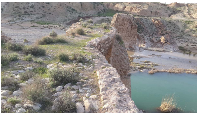
تصویر ۱۲. نمایی از پل کوار. جان پناه‌ها با ملات ساروج ساخته شده است (نگارندگان، ۱۳۹۶).