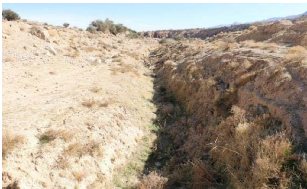
تصویر ۶. انتهای قنات (مظهر) و ابتدای کانال روبازی که به وسیله آن آب به خفر می‌رسیده است (نگارندگان، ۱۳۹۶).