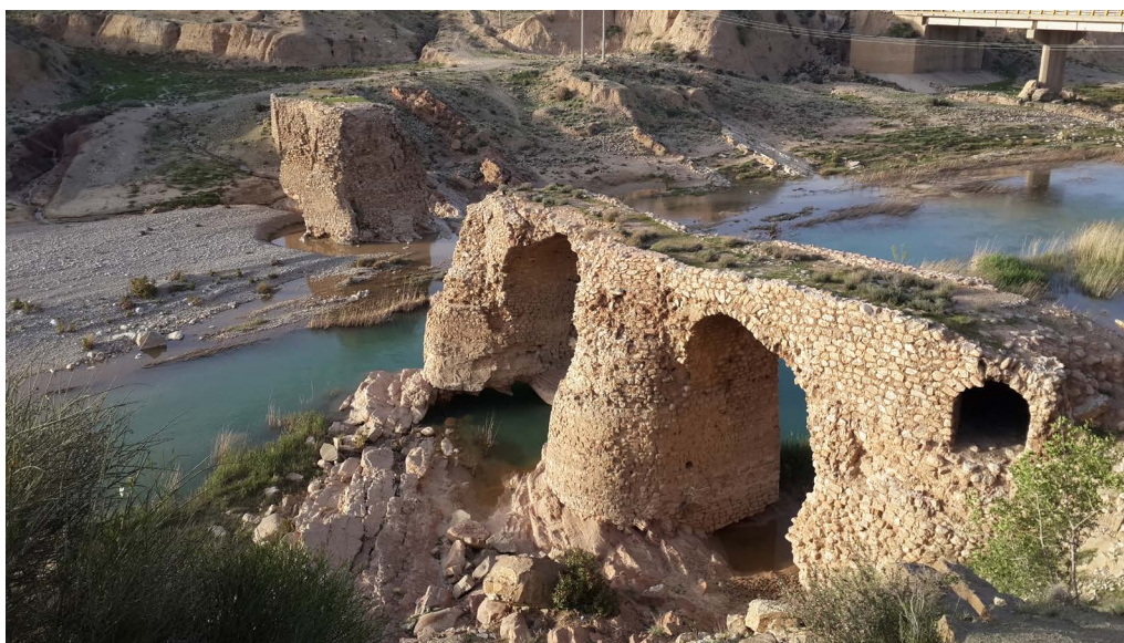
تصویر ۱۰. پل کوار از نمای جنوب غربی و مشرف بر اتاقک نگهدانی جنوبی (نگارندگان، ۱۳۹۶).