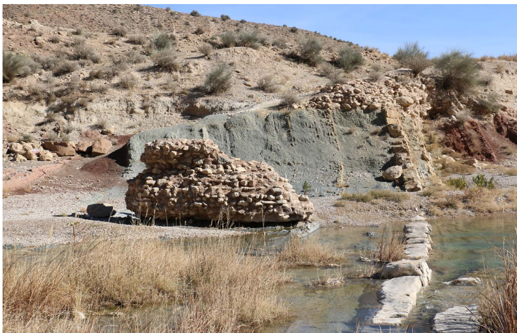
تصویر ۲. بخش دیگری از باقی مانده سازه به همراه بخشی از سنگ چین دیواره (نگارندگان، ۱۳۹۶).

این شیوه آبرسانی در دیگر نقاط ایران از سده‌های آغازین اسلامی نیز مرسوم بوده است؛ بدین صورت که ابتدا آب را با ساخت یک بند از سطح زمین‌های اطراف بالاتر آورده و سپس با احداث یک کانال بخشی از آب را به سمت شهر و یا زمین‌های زراعی هدایت می‌کرده‌اند، در صورتی که در این مسیر موانعی از جمله تپه‌ماهور نیز وجود داشته است و بالاجبار به سامانه قنات