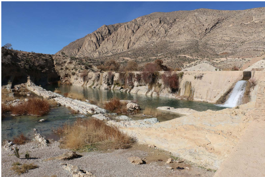
تصویر ۱. بند بهمن رودخانه به همراه تکه‌ای باقی‌مانده از سنگ‌چین سازه در مقابل آن.