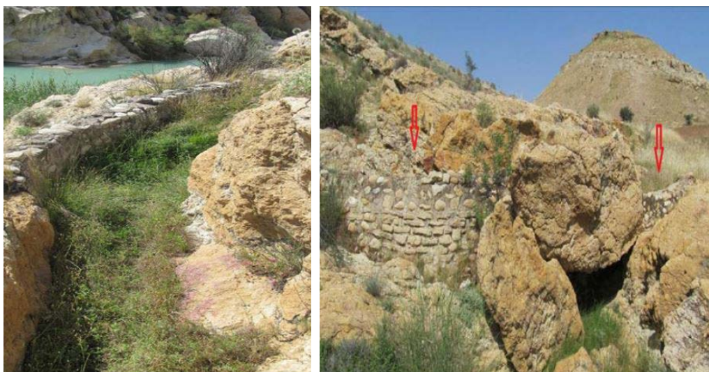
تصویر ۷. دیواره سنگ و ساروجی جهت هدایت آب از بند به قنات گرمز (رایگانی، ۱۳۹۴: ۲۰۱)؛ کانال انتقال آب از بند به قنات گرمز در ارجان (همان: ۲۰۲).

همان‌طور که اشاره شد، از این شهر با نام‌های دیگری نیز نام برده شده است. در حدود العالم نیز در توضیح نهر سکان آمده «این رود در فارس است و از کوه‌های آبادی رویجان سرچشمه می‌گیرد و مایل می‌شود به سمت شهر کور. سپس بین نجیرم و سیراف به دریای بزرگ می‌ریزد (حدود العالم من المشرق الی المغرب: ۵۹). این بلخی در سده ۶ ه.ق. این‌گونه از شهر کوار در مسیر شیراز تا سیراف یاد می‌کند: «از شیراز تا کفره، پنج فرسنگ. منزل دوم: کوار، پنج فرسنگ منزل سوم: خنیفقان، پنج فرسنگ منزل چهارم: فیروزآباد، پنج فرسنگ منزل پنجم: صمکان، هشت فرسنگ منزل ششم: هبرک هفت فرسنگ منزل هفتم: کارزین، پنج فرسنگ منزل هشتم، لاغر، هشت فرسنگ منزل نهم: کران، هشت فرسنگ منزل دهم: چهار منزل، از کران تا سیراف سی فرسنگ» (ابن بلخی،